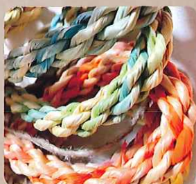
染色したヒノキリボンを編んだもの