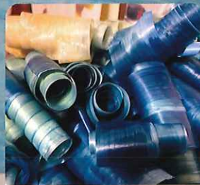
カンナで削った尾鷲ヒノキFSC認証を藍染めしリースにしたヒノキリボンアート作品

〒514-1136 三重県津市久居東鷹跡町246 https://www.tsuhisai-ars.jp