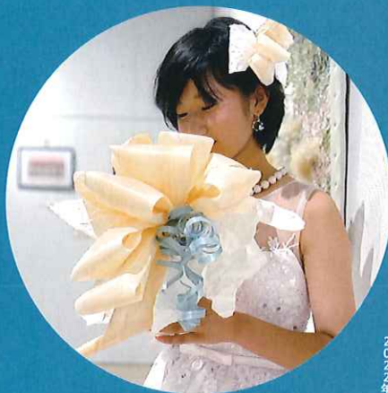
FSC認証 尾鷲ヒノキリボンウエディングブライド&ベール試着体験 第2回今を生きる展 2022年

なんかいい言葉だなあ〜。 覚えておこう。 きっと忘れられない言葉になるな。 ああ〜、しあわせポロリ♡