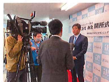
多くのメディアに取り上げられました